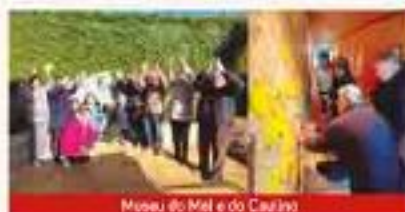
Museu do Mel e do Caulino