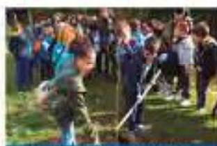
Plantação de árvores no Borfém/Rêxio