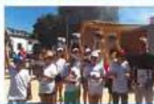
Encerramento do ano escolar