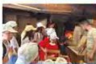
Encerramento do ano escolar