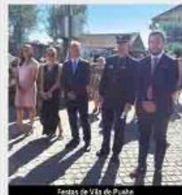
Festas de Vila de Punhe