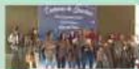
Comissão de Festas do Corpo de Deus