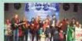
Centro Recreativo e Cultural das Neves