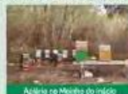
Azília no Meirão do início

Realça-se a visita de diversas instituições (lares) e escolas, incluindo a de Vila de Punhe e de vários particulares, sendo que, desde a sua inauguração (18/05/2021) e o final de 2022 já recebeu cerca de 1500 visitantes.