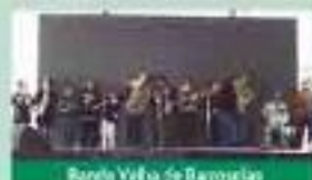
Banda Velha de Barrocelas