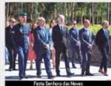
Festa Senhora das Neves