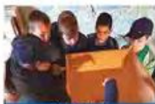
Moinho do Inácio