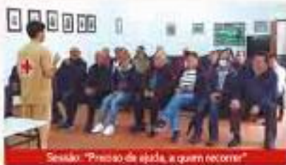
Sessão: "Preciso de ajuda, a quem recorrer"

se, a 14 de Abril no Pavilhão Desportivo de Meadela; na visita ao Museu do Mel e do Caulino; no passeio Sénior realizado em Abril à vila de Melgaço; na sessão de sensibilização "Burlas e Furtos nos Domicílios", apresentada pela equipa da GNR (Programa Escola Segura/Núcleo Idosos em Segurança), a 24 de maio. Esta ação serviu para esclarecer sobre as diversas burlas que surgem diariamente; e na caminhada ao Largo do Bonfim, no dia 30 de Junho.