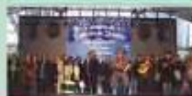
Grupo folclórico de Danças e Cantares de Alvarães