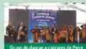
Grupo de danças e cantares de Perre