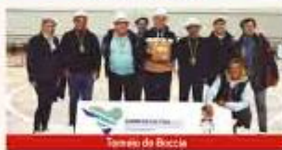
Torneio de Boccia