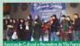
Associação Cultural e Recreativa de Vila Franca