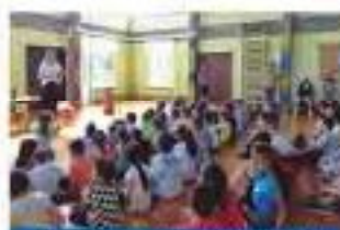
Dia da Criança - Contadora de Histórias