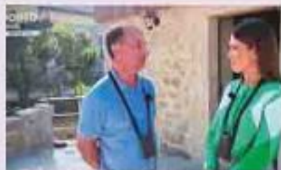
VIANA DO CASTELO - FORNO COMUNITÁRIO ADIVAR DO SÉCULO XXI E SEM UTILIZAÇÃO HÁ ANOS FOI TRANSFORMADA NUM FORNO PARA USO COMUNITÁRIO 30/10/2015 10:00:00 PARA VIVER AQUI PORTO CANAL 31 31/10/2015 13