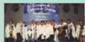
Grupo das Janeiras da Sra. das Boas Neves