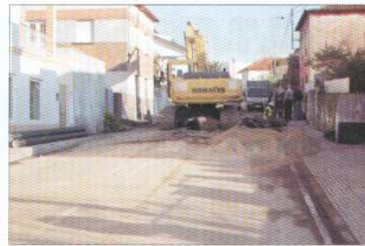
Obras de Saneamento e Água na R. Joaquim F. Moreira