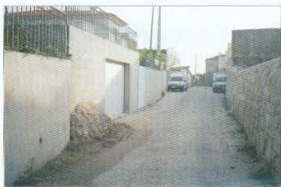
Pavimentação da Rua do Soutinho