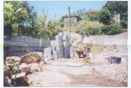
Alargamento da Rua dos Penedos