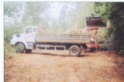
Trabalhos de Limpeza na Rua das Boucinhas