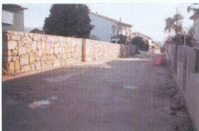
Alargamento e Construção de Muro na R. da Travessa