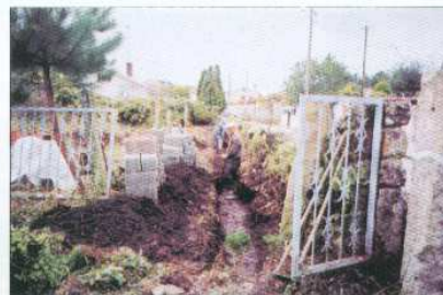
Alargamento de Rua