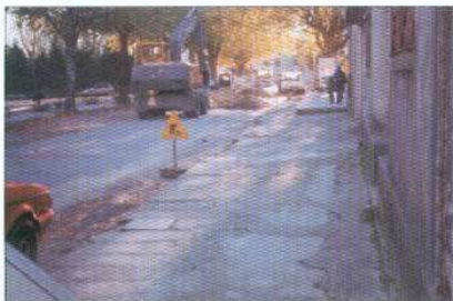
Obras de Saneamento e Água no Largo das Neves