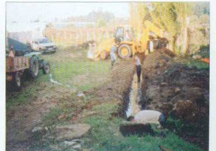
Drenagem de Águas da Fonte do Outrelo