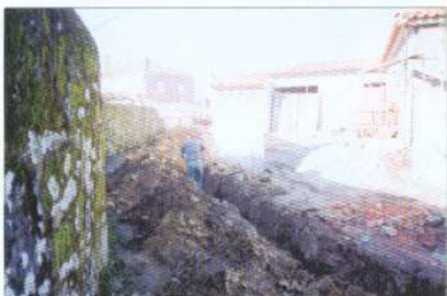
Alargamento e Colocação de Condução de Água na Rua dos Feirantes