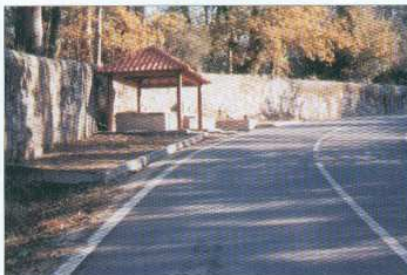
Recuperação do Tanque da Portela