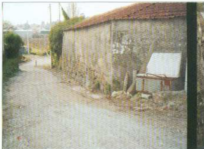
Arranjo da Rua da Fonte do Outrelo