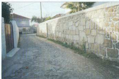
Const. de parte do muro na Rua de Sta. Eulália