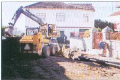
Obras de Saneamento na Rua da Barreira