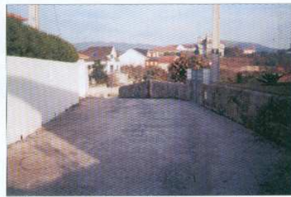
Alargam. e Paviment. da Rua Agra de Belgas