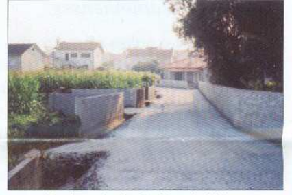
Pavimentação da Rua do Linhar