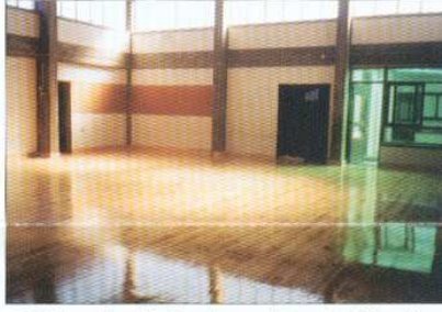
Colocação de Soalho na Escola Primária