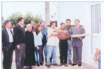
Entrega da Casa à Família dos Damásios