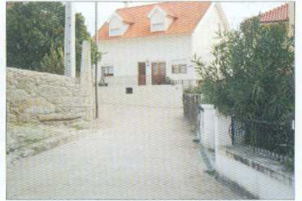
Pavimentação da Quelha do Cantinho