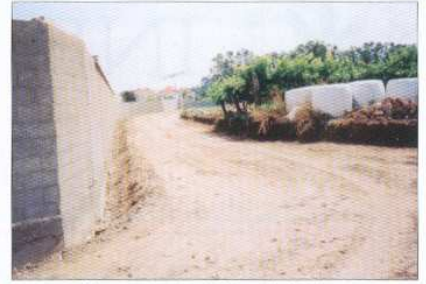
Alargamento da Rua do Linhar