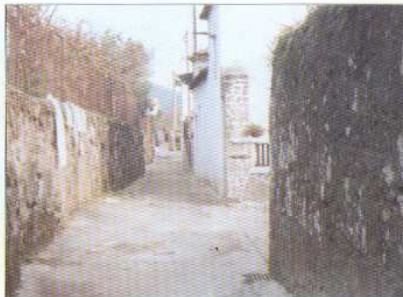
Pavimentação da Quelha do Outrelo