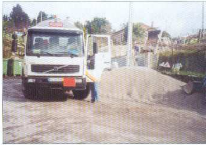
Pavimentação da Rua do Souto