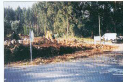
Alargamento da Rua das Carrascas