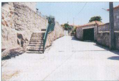
Alargamento da Rua do Soutinho