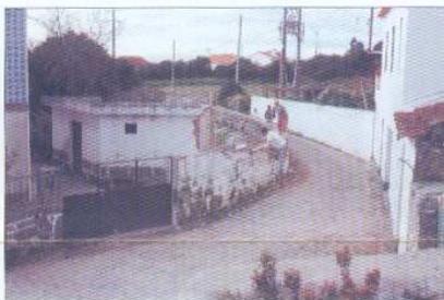
Alargamento da Rua de Santa Eulália