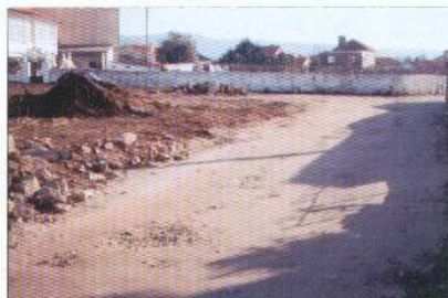
Alargamento da R. da Travessa e Albardeiros