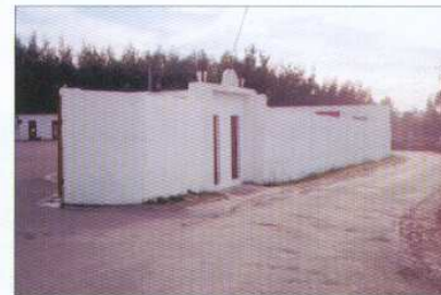
Construção de Muro e Pintura no Estádio do Neves