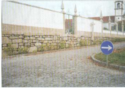
Pintura e Arranjo dos Muros do Cemitério