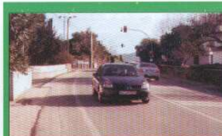
Semáforos no Cruzamento das Neves