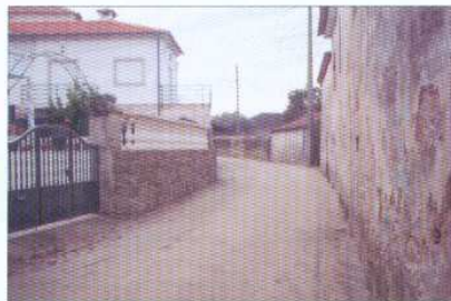
Pavimentação em Cubo da R. Senhor da Saúde