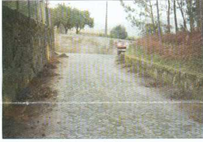
Limpeza de Bermas