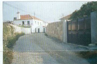
Alargamento e Construção de Muro