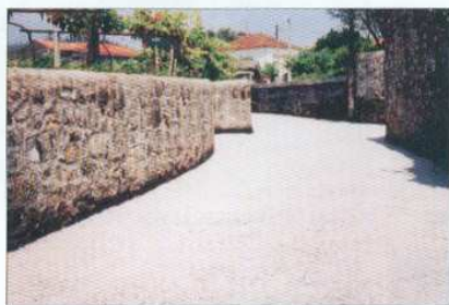
Rua das Azedas