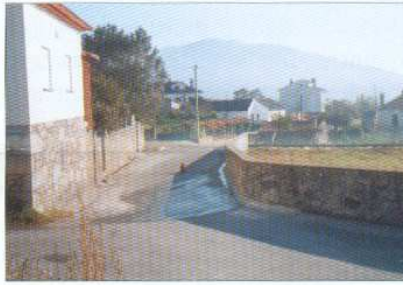
Pavimentação da Rua do Infante