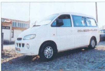
Apoio ao Transporte Escolar