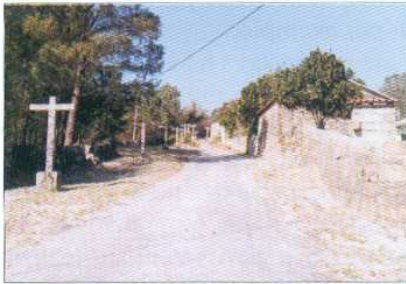
Limpeza e Manutenção do Histórico Calvário