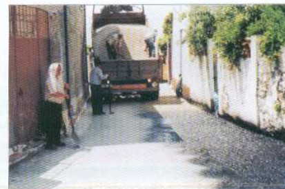
Reparação da Rua de Milhões