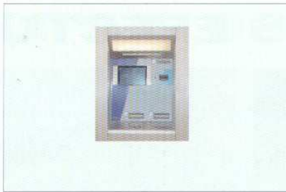
Caixa Multibanco no Largo das Neves