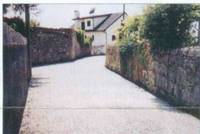
Pavimentação da Rua das Azedas