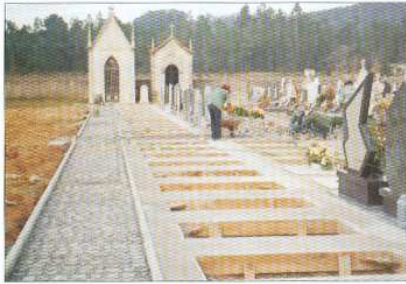
Construção de Novas Sepulturas