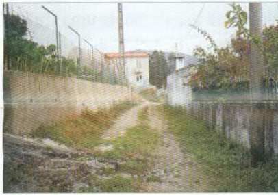
Alargamento da Rua da Abadia